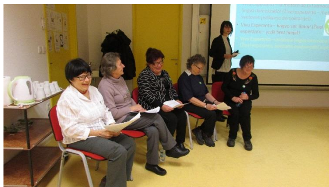
Krožkarice, ki so vztrajale do zaključka