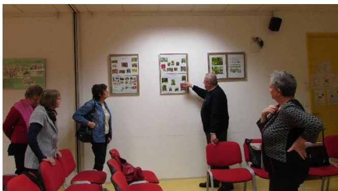
Ogled prigodne razstave

Srečanje je krasila tudi esperantska zastava, mentor pa je krožkaricam podaril tudi priponke »Mi parolas Esperanton«, kar so si udeleženke s posebnim zadovoljstvom pripele na obleko.